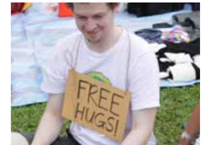
Post-Museum(ポスト・ミュージアム) 過去作品「リアリー・リアリー・フリーマーケット」より

Singapore-based artist group, 'Post-Museum' present "Ueno Care Club" Through lectures and workshops in various fields, Post-Museum opens an art project that promotes respect for others and creates spaces for society to care about each person. Post-Museum will run multiple programs where participants can learn about diverse lifestyle and connecting with others.