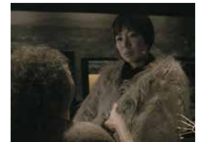
和田昌宏(Masahiro Wada) 本作品より

Screening of the video work, Nothing spring to mind as a name by Masahiro Wada Masahiro Wada presents a new science-fiction film that blends documentary with fiction.